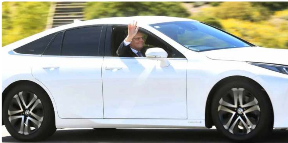
Australsk statsminister Scott Morrison i en hydrogenbil