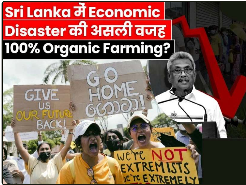
Økonomisk katastrofe på Sri Lanka