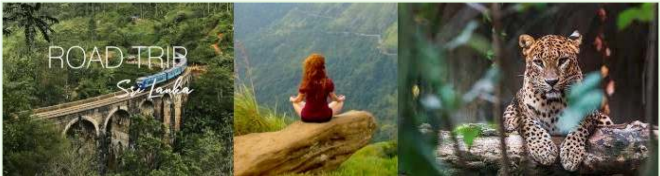
Sri Lanka ferier - Guidede naturturer og ekspedisjoner

Timing: Eksperimentet ble lansert under COVID-19-pandemien, da Sri Lankas turismeavhengige økonomi allerede var alvorlig påvirket.